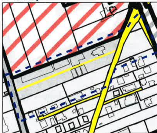
IST - Darstellung